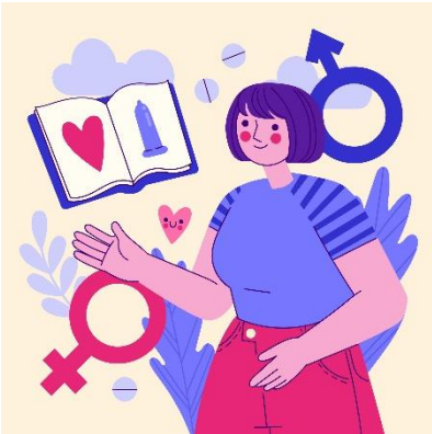
Proyecto de educación sexual