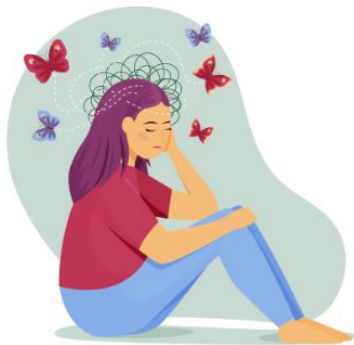
Día mundial de lucha contra la depresión