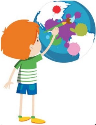
↙ Día Internacional del trastorno por Déficit de Atención e Hiperactividad