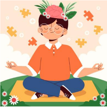
Día mundial de la salud mental