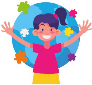
Día mundial de la concienciación sobre el autismo